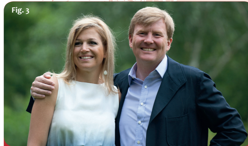
Willem-Alexander, roi à partir de 2013 et fils aîné de la reine Beatrix et son époux allemand, avec sa femme Máxima.

En Allemagne, cela fait bien longtemps qu'il n'y a plus de roi. L'Allemagne n'est donc pas dirigée par un roi, mais par un président. Tout comme le monarque, le président doit représenter dignement son pays à l'étranger, mais également auprès de sa population.