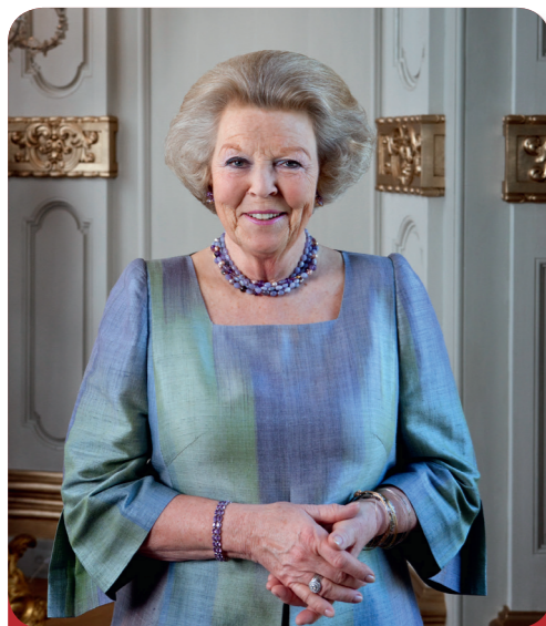
Fig. 1: Beatrix, reine des Pays-Bas 1980 - 2013.

Au Moyen Âge, des personnes puissantes régnaient souvent seules sur d'immenses régions. Dans l'Euregio, on avait, par exemple, le prince-évêque de Liège, le duc de Limbourg ou de Jülich ou encore de nombreux autres comtes et chevaliers. Mais à l'époque, celui qui était au-dessus de tous (en théorie tout du moins), c'était l' Empereur romain germanique .