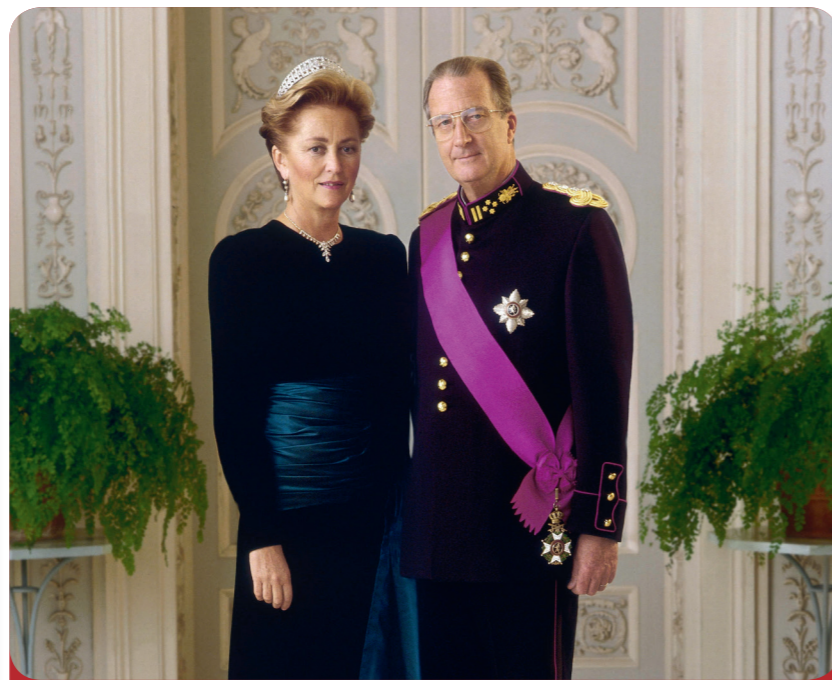
Fig. 2: Les monarques belges : Albert II et la reine Paola.