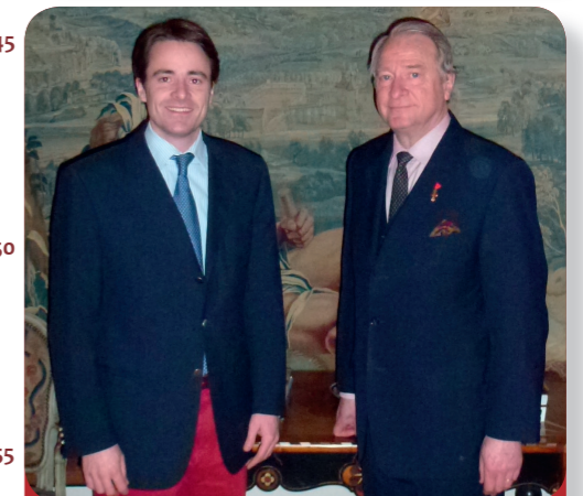
Fig. 5: Le prince Charles-Louis de Mérode et son fils Charles-Adrien.