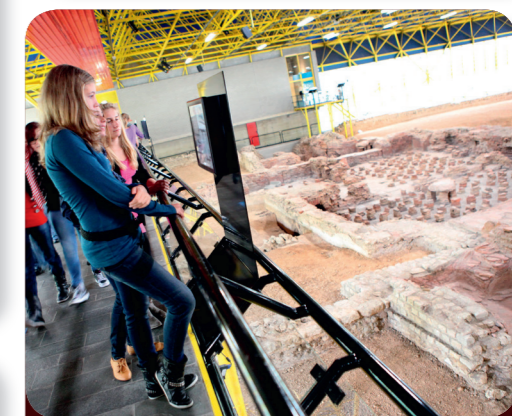
Afb. 6 - Grote en goed bewaard gebleven vondsten zoals de Thermen in Heerlen zijn zeer zeldzaam en worden daarom druk bezocht!

Zeer interessant: korte animatiefilms en een virtuele 3D-reis door "de omgeving van Xanten in de oudheid" ( xanten.afg.hs-anhalt.de , klik op "System mit Filmen starten")