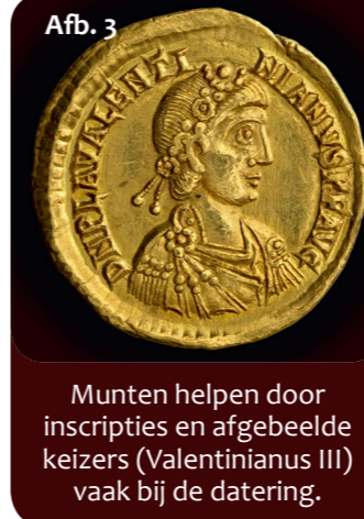
Afb. 3 Munten helpen door inscripties en afgebeelde keizers (Valentinianus III) vaak bij de datering.

behoefden van toen verschilden helemaal niet zo veel van die van nu.