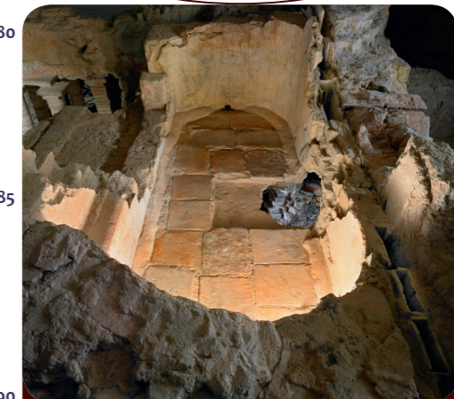
Afb. 4 - Dit soort baden stond in publieke badhuizen. Hier trof men elkaar en maakte een praatje.

Woorden die eindigen op "-tie" (zoals "informatie") komen meestal uit het Latijn en zien er in andere talen ongeveer hetzelfde uit. In het FR en het DE eindigen deze woorden op "-tion" (Information).