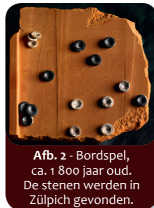
Afb. 2 - Bordspel, ca. 1 800 jaar oud. De stenen werden in Zülpich gevonden.

Archeologen, mensen die belangrijke wetenschappelijke opgravingen doen (maar daarmee ook vaak grote bouwprojecten vertragen!), vinden steeds weer interessante dingen. Plattegronden van gebouwen geven een idee van hoe groot de huizen vroeger waren. Alledaagse voorwerpen verraden hoe de mensen toen aten, dronken, werkten en speelden (afb. 2). Ook al was alles toen heel anders: de