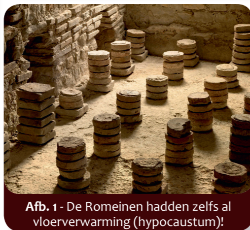
Afb. 1 - De Romeinen hadden zelfs al vloerverwarming (hypocaustum)!

2 Welke steden van nu horen bij de Latijnse namen op de kaart? (afb. 5)