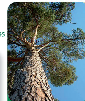
Afb. 6 - Pijnboom

• staatsbosbeheer • beesies.nl, • natuurmonumenten.nl/kinderen/ speurtochten