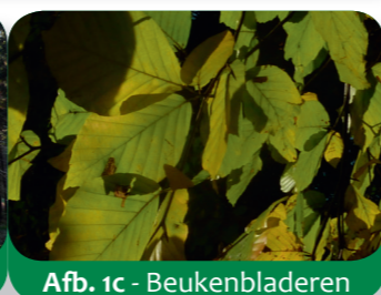
Afb. 1c - Beukenbladeren