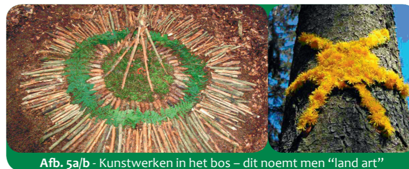
Afb. 5a/b - Kunstwerken in het bos - dit noemt men "land art"

In het bos valt er veel te ontdekken en te leren. Hiervoor ontstond er in Aken in 1980 zelfs een speciaal beroep: de "bospedagoog". Tegenwoordig vind je in vrijwel ieder land zulke natuurpedagogen. Samen met deze beleef en ontdek je met al je zintuigen de bomen, het bos, de planten en de dieren: zintuiglijke en behendigheids spelletjes, nachtwandelingen, eetbare en giftige planten, spoorzoeken, enz. Neem je vergrootglas en verrekijker mee, dan ontdek je nog veel meer!