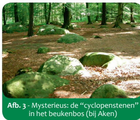
Afb. 3 - Mysterieus: de "cyclopienstenen" in het beukenbos (bij Aken)