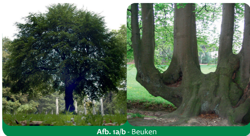
Afb. 1a/b - Beuken

Jullie organiseren een bosdag! Welk bos ligt in de buurt van onze school? Wat kun je al vooraf te weten komen over dit bos, welke bomen staan er? Wat moeten we meenemen?