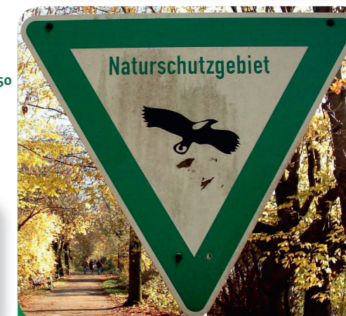
Afb. 7 - In beschermde natuurgebieden gelden speciale regels, zo mag je bijv. niet van de paden afwijken.

Op pad in het bos. Zoek een plaats uit waar jullie samen een tekening, beeld of misschien een hut willen maken uit natuurlijke materialen. Met takken, bladeren, vruchten, stenen ... (afb. 5). Plukken hoeft niet, verzamel alleen spullen die op de grond liggen.