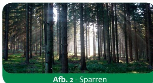
Afb. 2 - Sparren