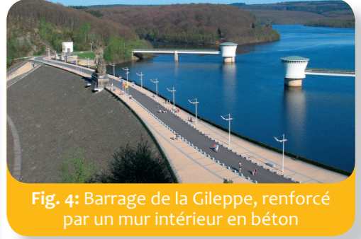
Fig. 4: Barrage de la Gileppe, renforcé par un mur intérieur en béton