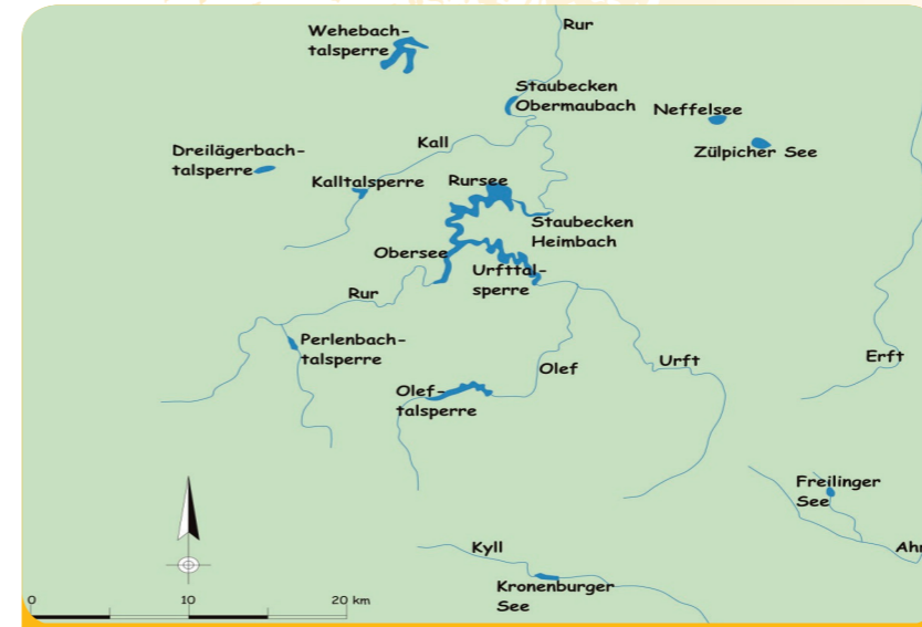
Fig. 3: Barrages de la Nordeifel (Allemagne)