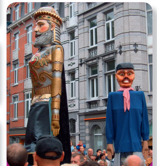
Afb. 6 - Tijdens feesten worden er reuzenpoppen van Tchantchès en Karel de Grote door Luik gedragen.