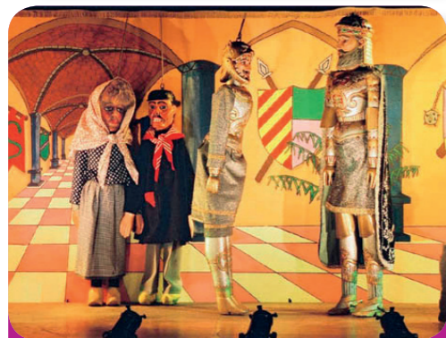
Afb. 1 - Nanesse, Tchantchès, ridder Roeland en Karel de Grote

Verzamel Duitse en/of Franse voornamen en zoek de Nederlandse “vertalingen” op. Kun je ook dialectnamen vinden?