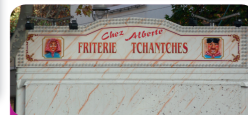
Afb. 5 - Er is zelfs een frituur naar de held genoemd!

Foto's van Tchantchès en informatie over zijn museum en het poppentheater (afb. 4) vind je op tchantches.eu .