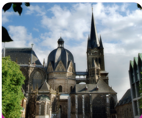
Afb. 1 - De Dom van Aken (het Munster)

De Dom van Aken is misschien wel het beroemdste gebouw in de Euregio (afb. 1). Dat komt vooral door de belangrijke functie die de Dom had voor de middeleeuwse keizers. Want in de middeleeuwen werden alle keizers eerst in Aken tot Rooms-Duitse koning gekroond. Aken was daarom al vroeg in heel Europa bekend, terwijl het in de middeleeuwen eigenlijk maar een zeer kleine stad was. De Dom was bovendien voor alle koningen bijna een “magische” plaats.