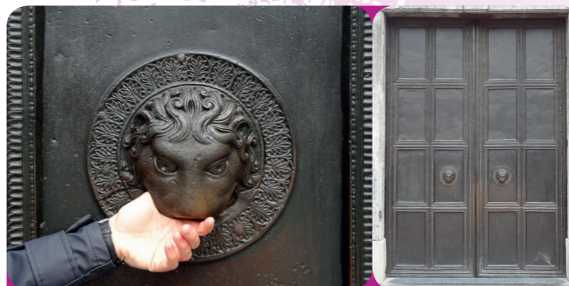
Afb. 3 - Naar aanleiding van de sage wordt de reusachtige bronzen deur van de Dom “Wolfstür” genoemd. In de leeuwenkop waar oorspronkelijk de deurring aan bevestigd was, kun je zelfs nu nog de duim van de duivel voelen.

Dus trok men het Akense bos in om één van de wolven te vangen die er toen nog leefden. Hij werd door de enorme bronzen deur van de kerk gejaagd, waarachter de duivel al vol verlangen zat te wachten. Zonder goed te kijken, rukte hij de ziel uit het lijf van het arme dier. Hij merkte natuurlijk al snel dat hij bedrogen was. Ziedend van woede sloeg hij het kerkportaal achter zich dicht, waarbij hij tot overmaat van ramp zijn duim ver-