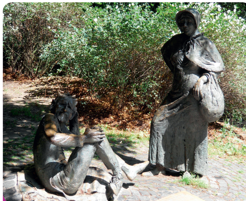
Afb. 5 - De duivel keerde terug naar Aken om wraak te nemen. Voor de marktvrouw die het ergste wist te voorkomen, werd op de Lousberg een monument opgericht.

Onderweg bedacht de vluchteling een duivels wraakplan, maar dat is weer een andere sage. Dit verklappen we alvast: veel zand, kapotte schoenen en een slimme (“luese”) Akense marktvrouw spelen een rol (afb. 5).