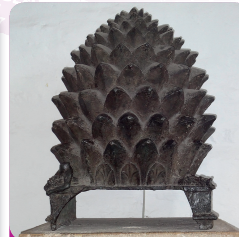
Afb. 4 - Voor velen stelt deze dennenappel de ziel van de wolf voor. Ook deze was vroeger onderdeel van een fontein.

75 Een duivelspact komt trouwens in veel sagen voor, het is een veel gebruikt “motief”, zoals men dat zegt. Ken je andere verhalen waarin de duivel een rol speelt?