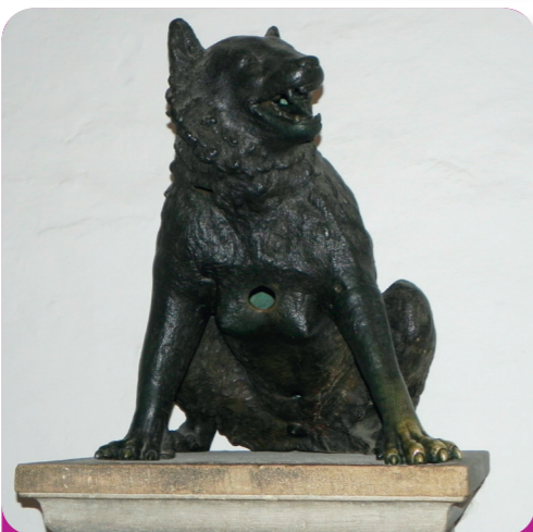
Afb. 2 - Deze bronzen figuur in de hal van de Dom heeft een gat in zijn borst. Daarom denken de meesten dat dit de wolf is uit de sage. Maar in werkelijkheid is het een berin. Ze was vroeger onderdeel van een fontein. Haar linkerpoot aanraken brengt geluk!

1 Wat zou waar kunnen zijn en wat is er waarschijnlijk ooit bij verzonnen?