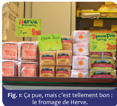
Fig. 1: Ça pue, mais c'est tellement bon : le fromage de Herve.

Toutes les régions ont leurs particularités ; elles leur permettent de se différencier les unes des autres et sont souvent affichées avec fierté. Cela est particulièrement vrai pour tout ce qui touche à la nourriture et aux boissons. Ces « spécialités régionales » sont notamment mises en avant pour attirer les touristes.