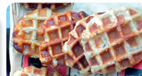
Fig. 6: Les gaufres de Liège, ou les « gauff' au suc »