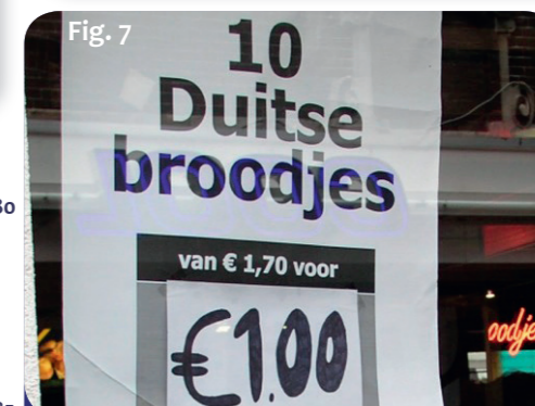
Fig. 7: Les petits pains (et le pain noir) allemands : de vraies spécialités pour les pays voisins.

Les boissons pourraient certainement faire l'objet de tout un chapitre. Interdit aux enfants, mais très apprécié par les adultes, c'est le genièvre : Jenever de Hasselt, Pekèt de Liège et Els de l'Eifel ou du Limbourg. Les spécialités belges de bières sont maintenant connues dans le monde entier ; les bières d'abbaye sont particulièrement appréciées (bières de l'abbaye de Val Dieu, par exemple). Une des boissons les plus appréciées de l'Euregio, qui a d'ailleurs du succès bien au-delà de nos frontières, est en même temps la plus simple : tous les Belges et les Néerlandais connaissent l'eau de Spa et de Chaudfontaine.