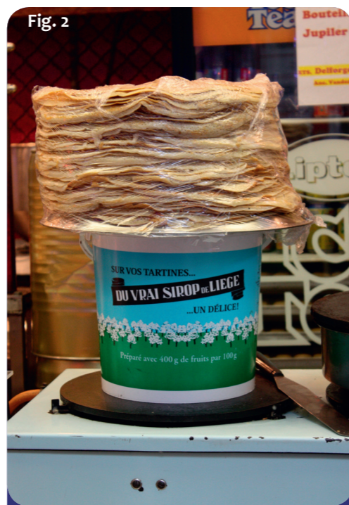
Fig. 2: Avec des crêpes, du fromage, du pain ou comme ingrédient de cuisine : le « Sirop de Liège » convient pour tout.

Le secteur de la pâtisserie compte également son lot de spécialités régionales ; quelque chose qui fait toujours plaisir lorsque l'on va rendre visite à des