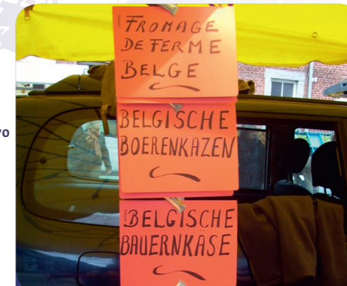
Fig. 3: Sur le marché d'Aubel, on parle plusieurs langues.

Typiquement « eurégionale » : la tarte au riz.